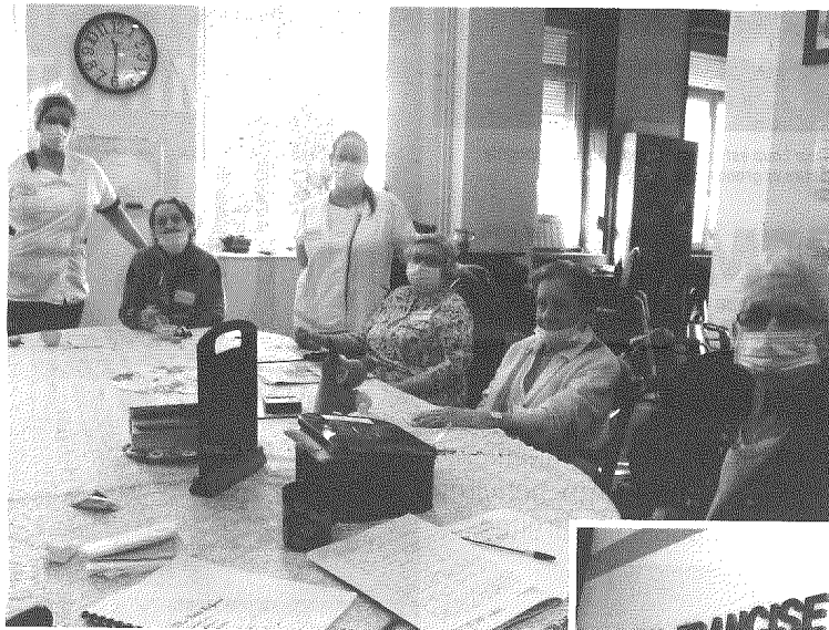
Les résidentes et les animatrices du PASA, réunies dans une ambiance conviviale.

Si les unités Alzheimer commencent à se démocratiser, les Pôles d'activités et de soins adaptés (PASA) sont quant à eux beaucoup plus rares. Il s'agit